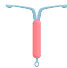
DISPOSITIVO INTRAUTERINO (DIU)

Los ANTICONCEPTIVOS DE EMERGENCIA se pueden emplear después de tener relaciones sexuales sin protección o cuando falla otra forma de control de natalidad.