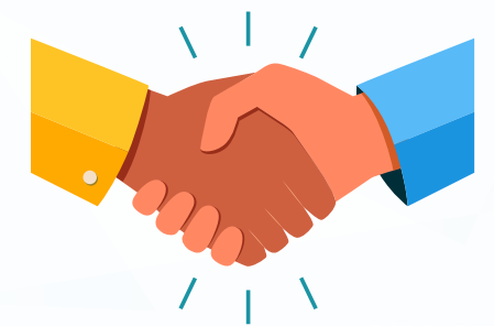
un apretón de manos